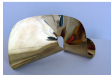
Rytmisk Plan I - 1950